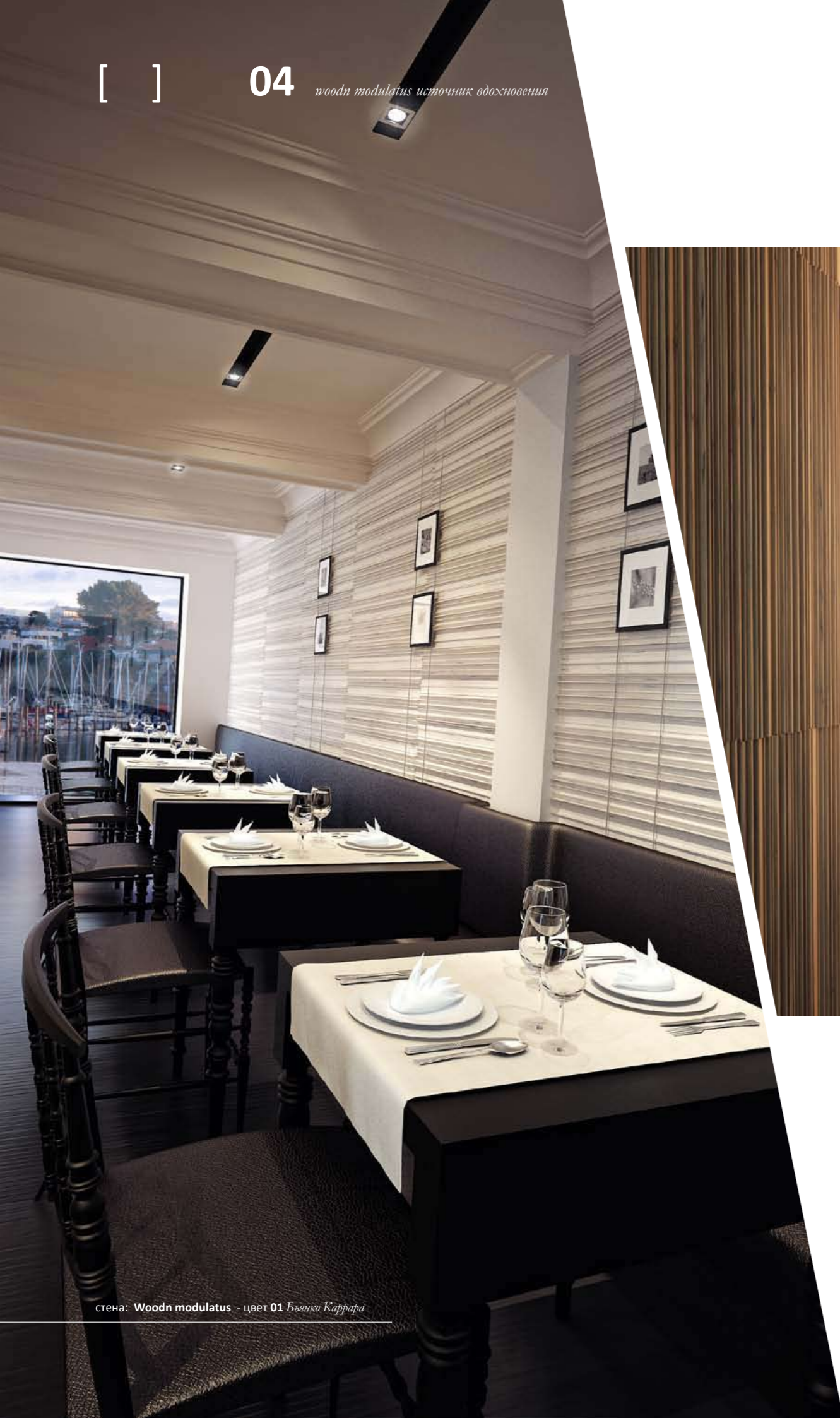
стена: Woodn modulatus - цвет 01 Бьянко Каррара